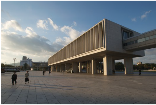
Peace Memorial Museum ( Kenzo Tange)