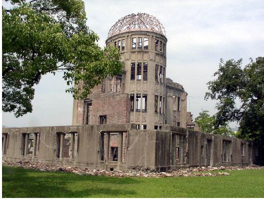
Genbaku Dome(Ayakta kalan tek yapı)