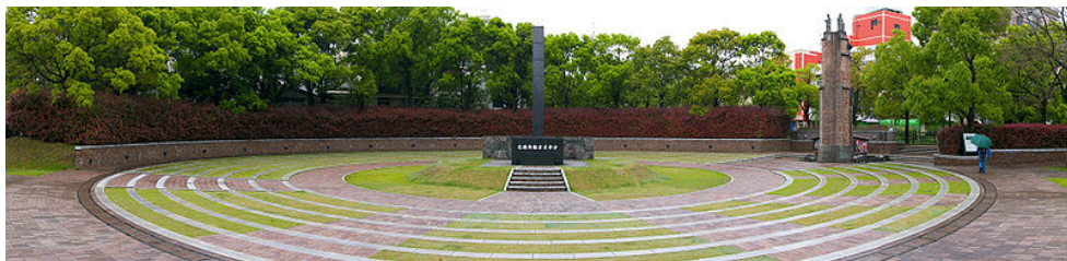
Nagasaki Ground Zero