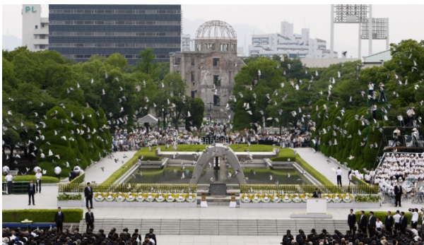
Peace Memorial Park