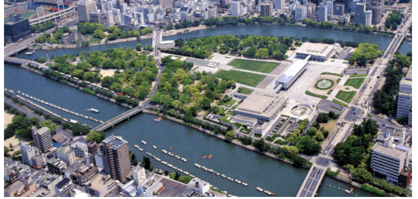
Peace Memorial Park