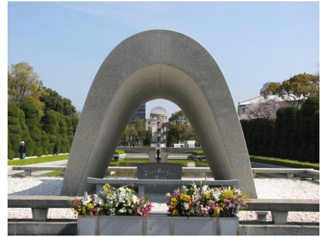
Peace Memorial Park